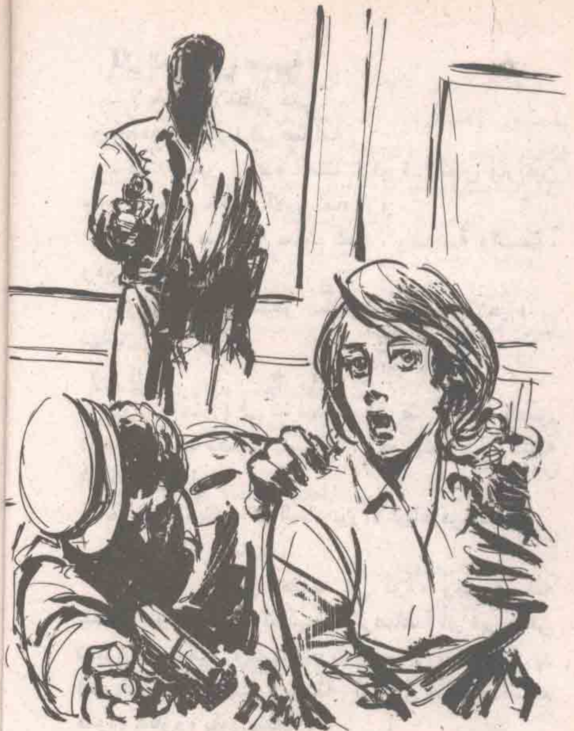
ولكنها شعرت بالمسدس يرتجف فى يد الشرطى ، الذى تشبث بها لحظة ، ثم هوى جثة هامدة ..

- هيا .. اسحب مسدسك يا ( جوزيه ) .. امنحنى المبرر المنطقى لتمزيقك إرباً ، وإلقاء جثتك لكلاب الشوارع .. ولو أن ( جوزيه ) فى موقف آخر ، لسحب مسدسه فى سرعة ، وأطلق النار ، مثلما كان يفعل فى الماضى ، ولكنه كان يعرف ( أدهم ) جيداً ، منذ أيام ( كال ) ، عندما تعامل